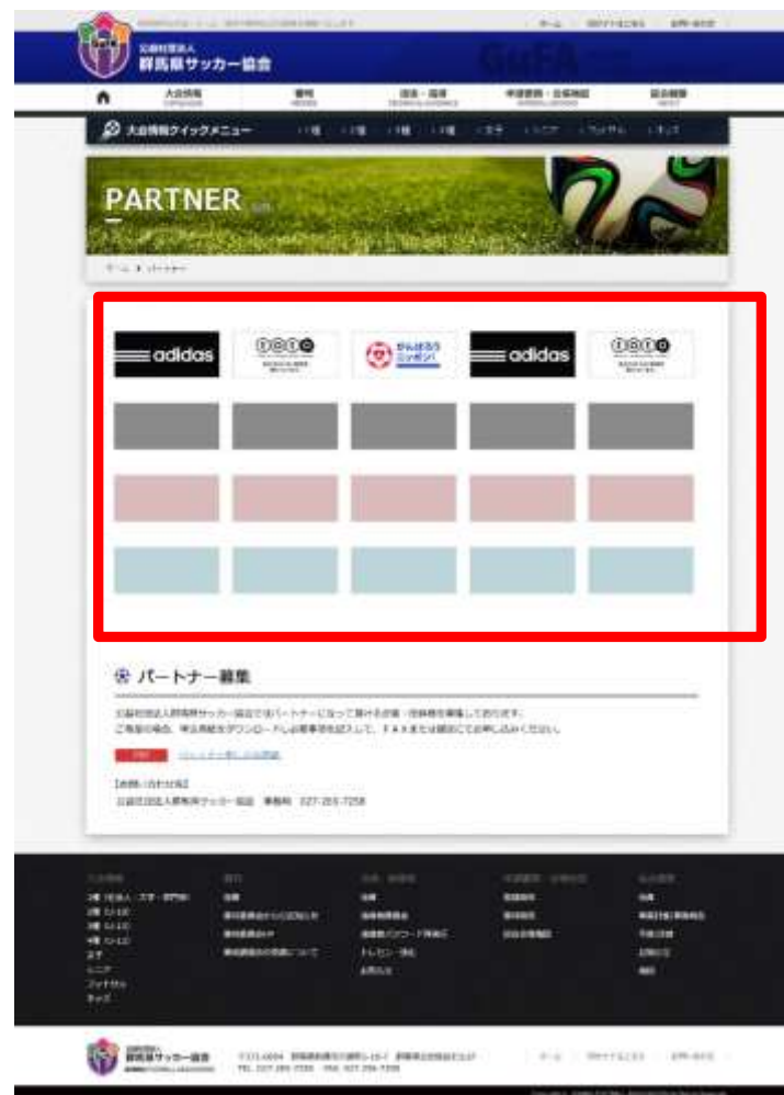
パートナー(協賛)専用ページ